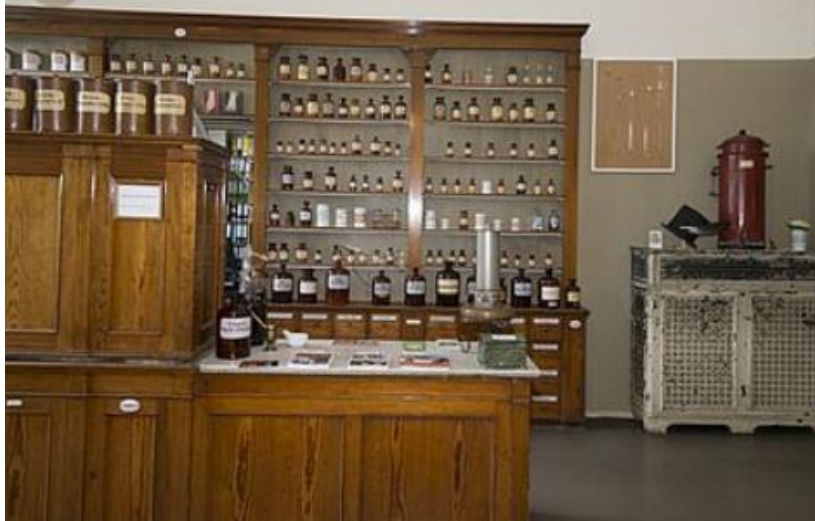
Fontane-Apotheke im Bethanien

Anschließend ging es nach Neuruppin. Programm entsprach dem Programm 1994 („sog. „Null“-Nummer) - 02. - 06.10.1996) -.