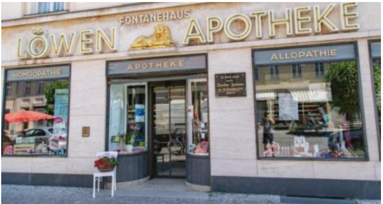
Fontane Geburtshaus in Neuruppin