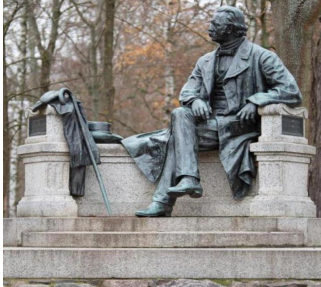
Fontane Denkmal in Neuruppin